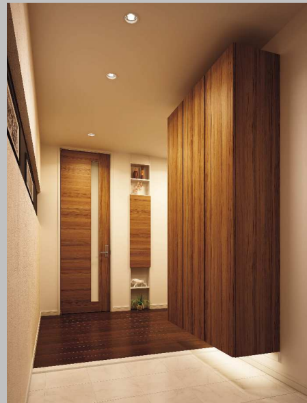
※参考イメージ(実際の玄関収納にはミラー扉が付きまます。)