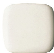
#SC1 パステルアイボリー